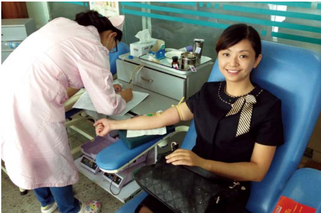
· 江苏银行员工积极参加无偿献血

在投身慈善公益的同时，我行积极调动全员力量，组织志愿者活动，壮大慈善公益力量。2013 年全行累计献血 500 多人次，联合银监部门开展了“弘扬雷锋精神”金融服务进社区活动、环太湖绿色长跑、走入敬老院关爱老人、走进福利院关心智障儿童、关心环卫工人等一系列志愿者活动，全年累计志愿者活动时长达 1087 小时。