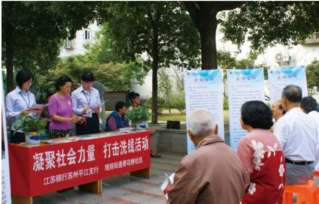
· 我行积极开展“反洗钱”知识普及活动，保护客户权益